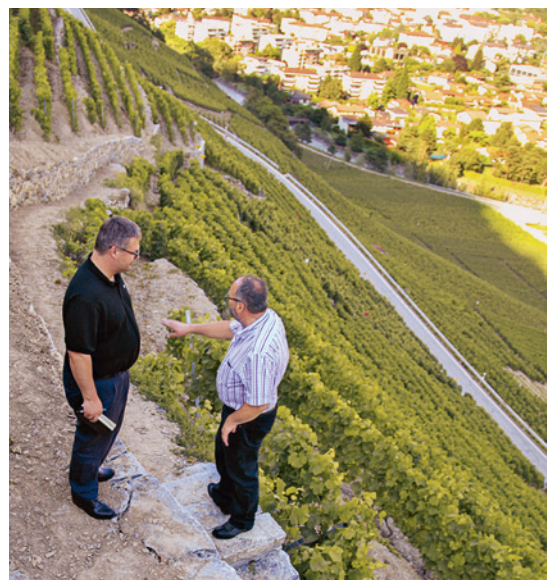
Besse besitzt mit die steilsten Lagen der Schweiz.