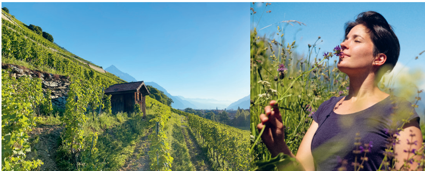
Die Steillage Les Bans erbringt die besten Chasselas von Besse.