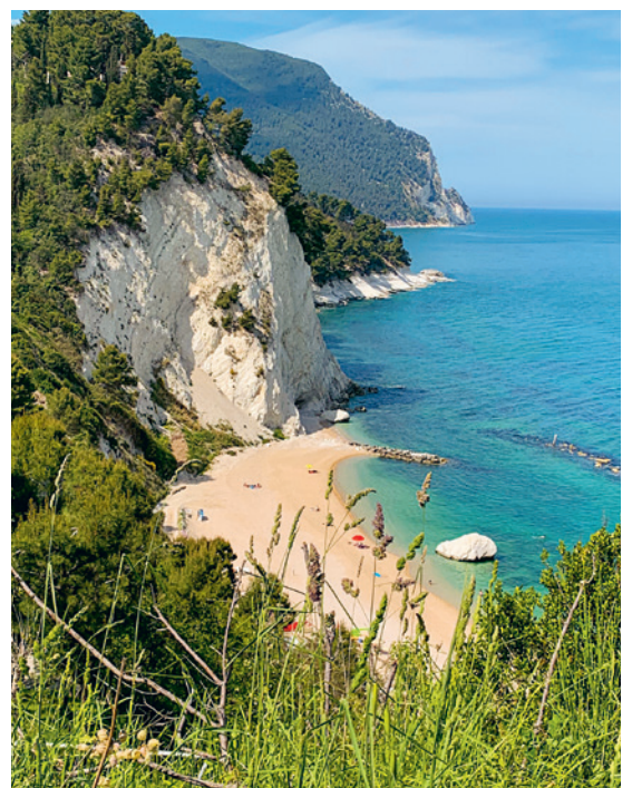
Küste bei Numana-Sirolo.