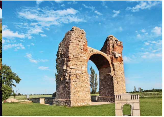
Blick vom Schüttenberg Richtung Göttlesbrunn sowie das Heidentor der römischen Stadt Carnuntum.