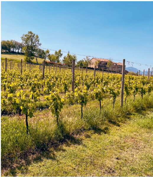
Die Rebberge von Casal Farneto.